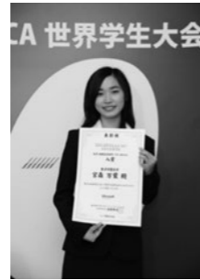
MOS世界学生大会の 最終選考に進出

2回目の出場となる2018年は、ノーマスカットタイムも前年の自己記録を大幅に更新し、「日本1位」を獲得しました。