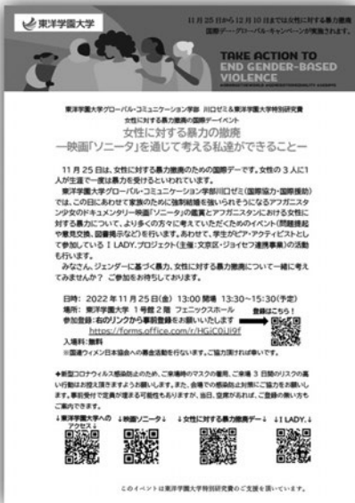
学生が開催した「女性に対する暴力撤廃国際デー」映画イベントのチラシ