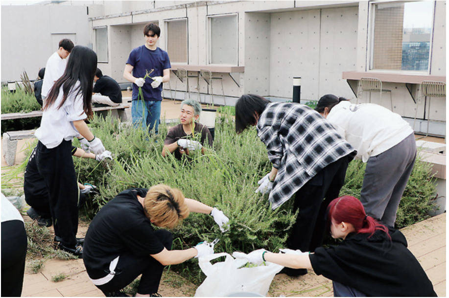
屋上のローズマリーを使った商品開発（野村ゼミ）