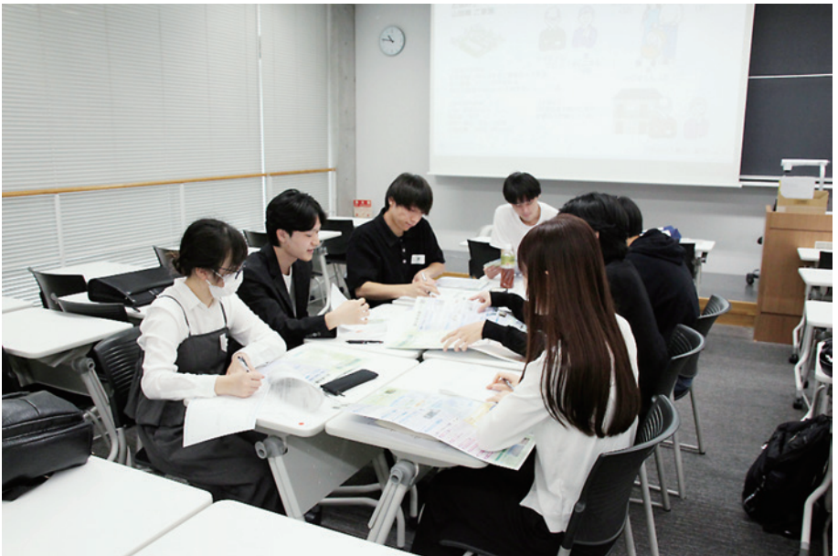
初開催の「オープンカンパニー」